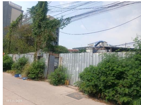
ภาพที่ 2.2-10 แนวรั้วบริเวณบ้านพักคนงาน