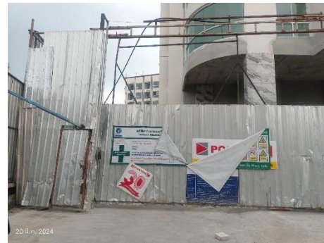
ภาพที่ 2.2-3 การปิดทึบบริเวณทางเข้า-ออก พื้นที่ก่อสร้าง