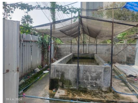
ภาพที่ 2.2-13 ห้องน้ำ ห้องส้วม และลานซักล้างบริเวณบ้านพักคนงาน