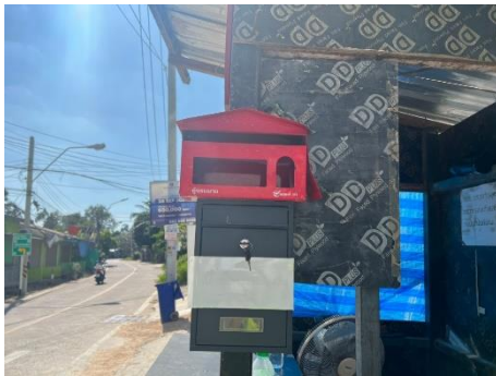
ภาพที่ 2.2-2 กล่องรับความคิดเห็นและเบอร์ติดต่อ