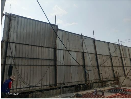
ภาพที่ 2.2-1 แนวรั้ว Metal Sheet