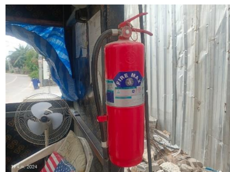
ภาพที่ 2.2-7 ถังดับเพลิงบริเวณพื้นที่ก่อสร้าง