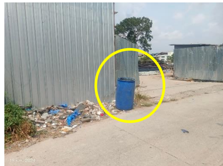
ภาพที่ 2.2-12 ภาชนะรองรับมูลฝอยบริเวณ บ้านพักคนงาน