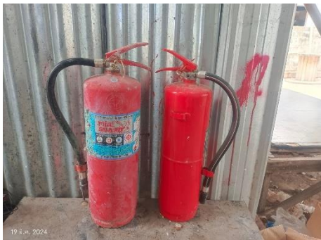
ภาพที่ 2.2-11 ถังดับเพลิงบริเวณบ้านพักคนงาน