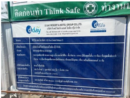
ภาพที่ 2.2-4 ป้ายประชาสัมพันธ์โครงการ