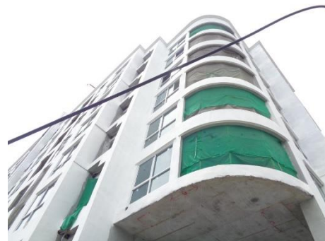
ภาพที่ 2.2-5 การปิดคลุมตัวอาคาร