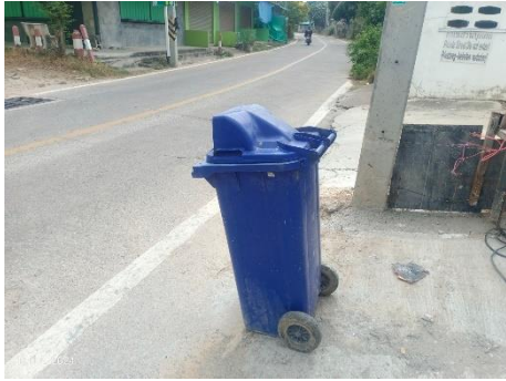
ภาพที่ 2.2-8 ภาชนะรองรับมูลฝอย บริเวณพื้นที่ก่อสร้าง