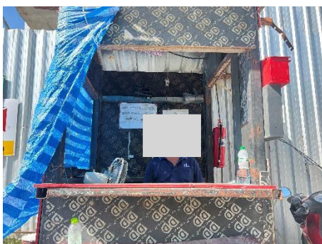
ภาพที่ 2.2-6 เจ้าหน้าที่รักษาความปลอดภัยและ อำนวยความสะดวกด้านจราจร